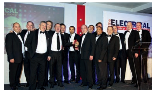
BEW Electrical Distributors Ltd: ομαδική φωτογραφία των χαρούμενων «Πωλητών χονδρικής της Χρονιάς»

Οι κριτές επαίνεσαν την επένδυση της εταιρίας στο ανθρώπινο της δυναμικό και την εξαιρετική εξυπηρέτηση των πελατών της. Είναι, πράγματι, ένα σπουδαίο επίτευγμα για την εταιρία, καθώς το προηγούμενο έτος ήταν ιδιαίτερα πολυάσχολο: η BEW άνοιξε δύο νέα παραρτήματα, μετέφερε ένα τρίτο και παρουσίασε ανάπτυξη της τάξεως του 30%. «Ήταν το κερασάκι στην τούρτα της τριακοστής μας επετείου». Δήλωσε ο πρόεδρος Phil Webb.