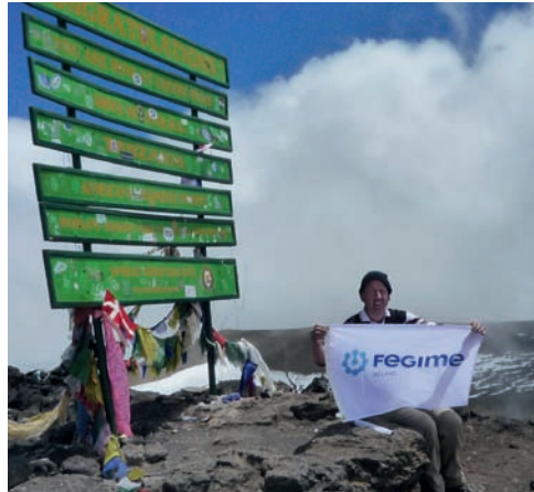
Το λογότυπο της FEGIME (αριστερά) στο όρος Κιλιμάντζαρο και (δεξιά) σ' ένα όχημα παράδοσης.